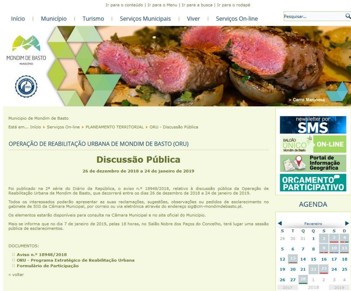
Figura 4 – Janela do sítio oficial da página da internet do município dedicado à Discussão Pública da ORU.