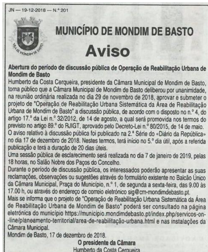
Figura 2 – Publicação do Aviso no “Jornal de Notícias”, a 19 de dezembro de 2018