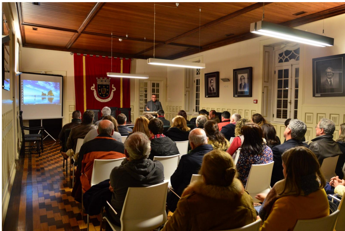
Figura 5 – Sessão Pública de Esclarecimento