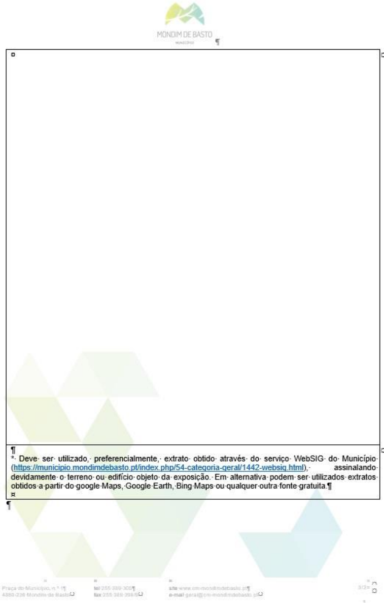
Figura 7 – Ficha de Participação Pública (página 3)